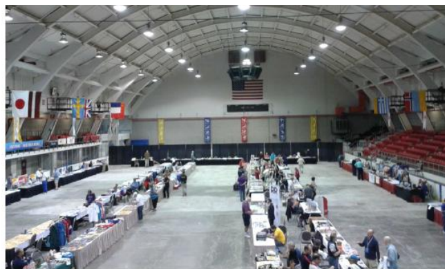
THE WINTER OLYMPIC ARENA IN LAKE PLACID, USA