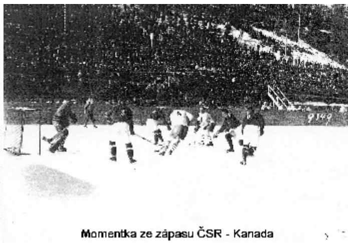
Momentka ze zápasu ČSR - Kanada

Po dvaceti letech, v roce 1948, se V. ZOH vrátily do Svatého Mořice. Švýcarská pošta vydala k ZOH 4 známky a mezi nimi byla také známka hokejového brankáře, první známka na světě s tímto námětem.