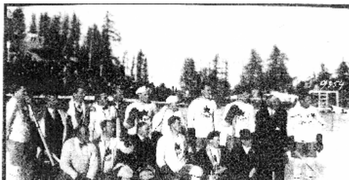
Fotografie mužstev Kanady a Švýcarska

Pohled na olympijský stadión s přírodním ledem, kde se tehdy konaly soutěže v krasobruslení a hrál olympijský turnaj v ledním hokeji za účasti sedmi mužstev. Hokej tehdy vyhrála Kanada před Švédskem a Švýcarskem. ČSR skočilo až na šestém místě.