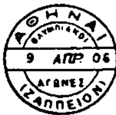
II ZAPPEION ZAPPION