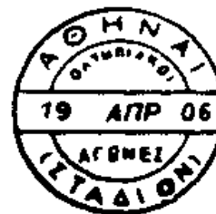
III STADION STADIUM