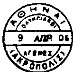
I AKROPOLIS ACROPOLIS

Athénské mezihry se konaly 9. – 19.4.1906. Řecká pošta při této příležitosti používala tři ruční příležitostná razítka, která bylo možno získat na Olympijském stadionu, v Zappeionu, sídle organizačního výboru her a na Akropoli, symbolu Athén a cíli všech jeho návštěvníků. Razítka byla používána po celou dobu her s výjimkou razítka na stadioně, které první den her, tedy 9.4.1906 v používání nebylo. Z pohledu na další tabulku je patrné, že zjevně nejdražší a tím také nejhledanější je razítko, používané v Zappeionu.