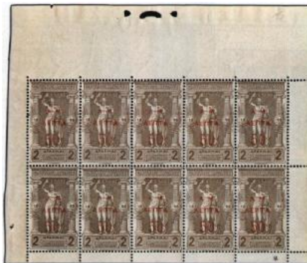
← Obr.3 Levý horní přepážkový arch hodnoty 1 lepta