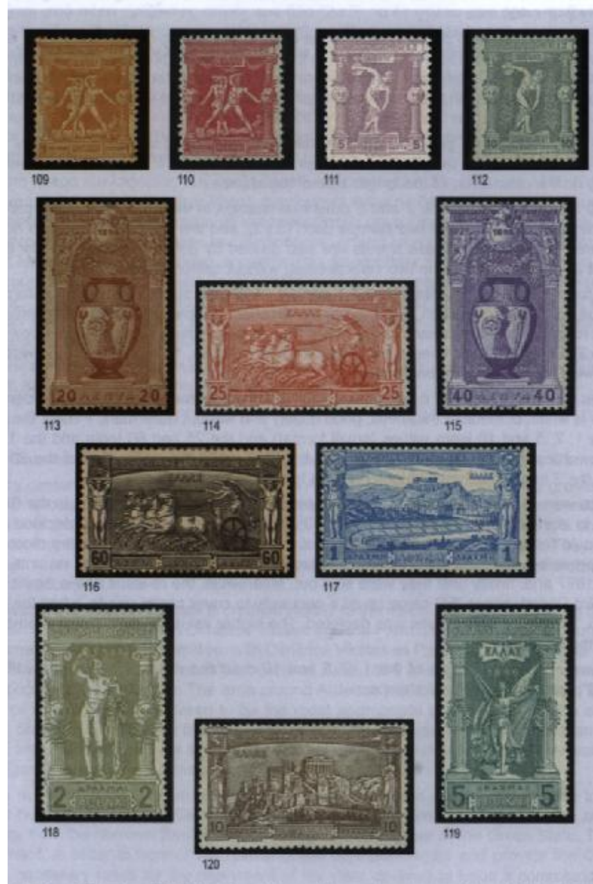
Obr 1. I. olympijská série Řecka 1896