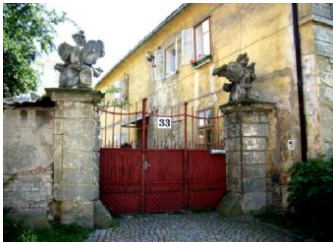
V tomto heřmanoměstském domě v tzv. Medově se 24. ledna 1861 narodil zakládající člen Mezinárodního olympijského výboru Jiří Guth-Jarkovský

v sobotu 22.1.2011 používala pošta Praha 6 poštovní strojové razítko (orážecí strojek Postalia - v černé barvě) u příležitosti 150. výročí narození Jiřího Stanislava Gutha-Jarkovského, významného propagátora sportu a olympijské myšlenky. Příležitostný razítkovací štoček byl dán do provozu z iniciativy České asociace pro olympijskou a sportovní filatelii OLYMPSPORT, která je součástí Svazu českých filatelistů.