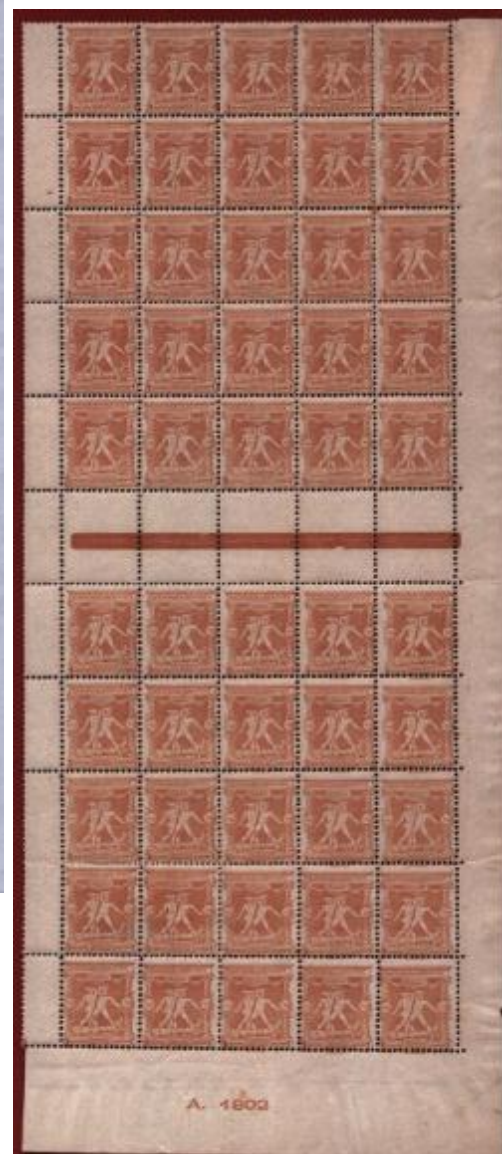
Obr 1. I. olympijská série Řecka 1896

Historie novodobých olympiád je navázána na olympijské hry antického Řecka, pořádané zhruba v období okolo devátého stol.př.Kr. Po několik století udržovaná tradice antického Řecka reprezentovala největší sportovní událost se značným politickým významem. Hry se konaly pravidelně ve čtyřletém intervalu a trvaly vždy pět dnů. Jejich konání bylo uzavřeno kolem konce 4.stol. před Kristem.