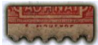
Obr.7 Chybějící dolní polovina jména rytce

Podívejte se na rozdíl mezi katalogovými čísly 110 a 110a viz (obr.6). Ten tvoří chybějící jméno rytce Mouchona u čísla 110a. U značného počtu chybí pouze spodní polovina jména rytce. Tyto známky však považujeme za katalogové číslo 110 (viz obr.7).