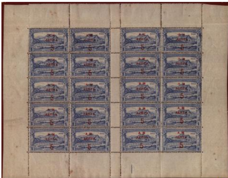
Obr.6 Rytce Mouchon