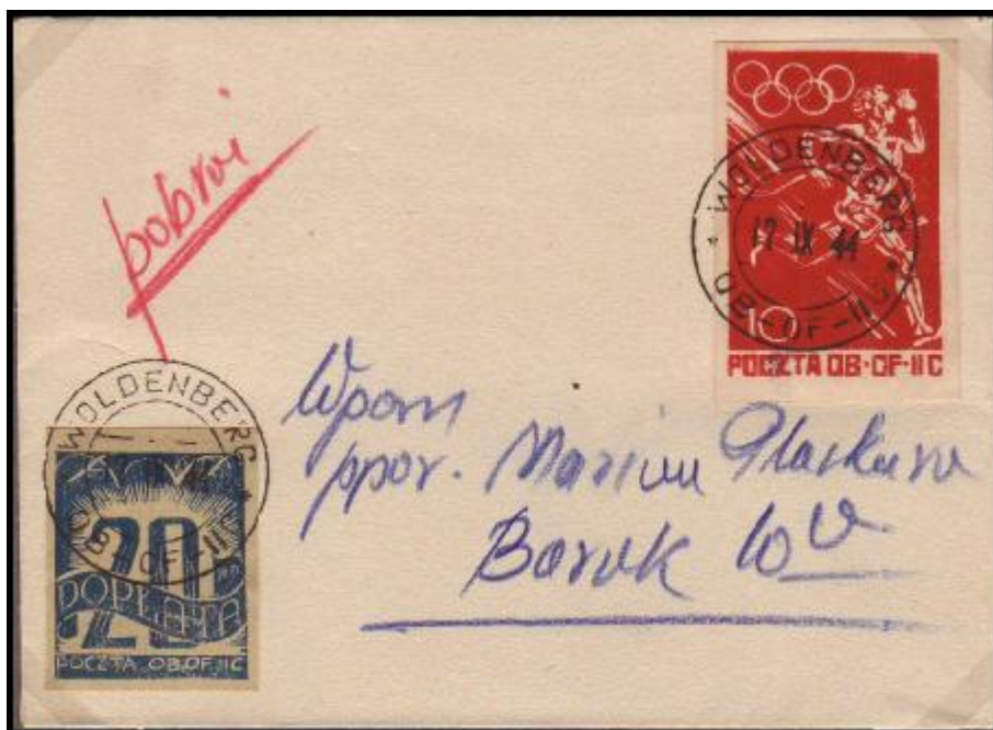
Dopltní známka 20 Pf dvojnásobek chybějícího poštovního) na dopise s nedostačující frankaturou. Woldenberg 12.IX.1944.