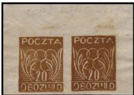
Část aršíku před provedení perforace.

Nedostatek všech druhů materiálů a vybavení pro tisk vedl k používání papíru od cigaretového až po karton, k rozdílům v odstínech barvy, velikosti známek a dalších poštovních forem, druhů perforace apod.