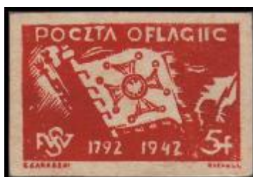
TÁBOR IIC WOLDENBERG 1. vydání: 4 V 1942 Počet vyd. známek: 677.635