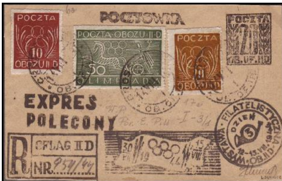
Ilustrovaná poštovní celina (obrázek na zadní straně) odeslaná DOPORUČENĚ a EXPRES z Gross Bornu 14.8.1944.