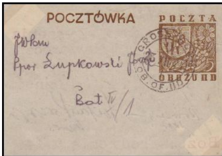
Celina, 5Pf, odeslaná v Gross Bornu 23.XII.1944