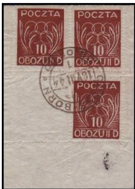
Ojedinelý větší část tiskového archu s viditelnou perforací.