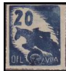
TÁBOR IIA MURNAU, 10 December 1943. Příležitostná poštovní známka připomínající 50. jezdecké závody, uspořádané Táborovou jezdeckou asociací. Známky byly tištěny v malém nákladu v různé době, což způsobilo rozdíly v barevných odstínech jednotlivých nákladů.