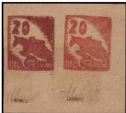
Unikátní zkusmé tisky 20 Pfg "koňské" známky v různých odstínech hnědé barvy. Dole: zadní strana ústřížku.