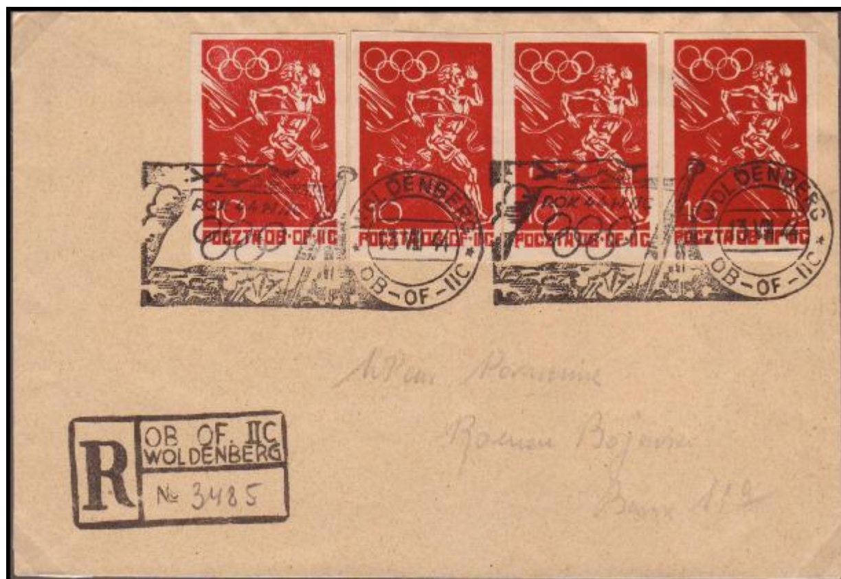
Doporučeně odeslaný dopis, frankovaný čtyřmi 10Pf olympijskými známkami, přesně podle tarifu.

Svaz táborových vojenských klubů, pracující v táboře IIC Woldenberg zorganizoval ve Woldenbergu vězeňské sportovní hry proto, aby připomenul olympijský rok 1944. Hry se konaly od 23. července do 13. srpna 1944, v posledním dnu her táborová pošta Woldenberg vydala příležitostnou známku a používala i příležitostné olympijské razítko.