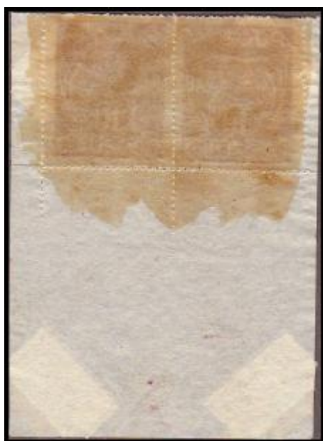
Kvůli nedostatku klovatiny, se lep nanášel pouze na zadní stranu známek, nikoliv na okraje archu.