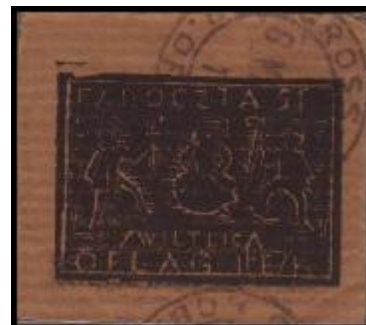
TÁBOR IIE NEUBRANDENBURG 1. vydání: 22 I 1944 Počet vydaných známek: 12 357