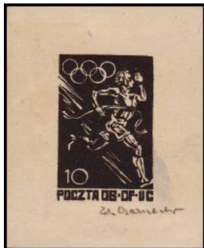
Essay 10Pf návrhu Woldenbergské známky v černé barvě je jediným známým kusem.