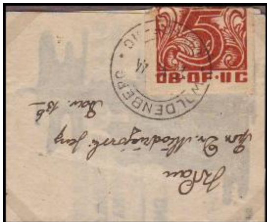
Tiskovina, odeslaná ve Woldenbergu 25 VI.1944.

S využitím zkušeností předválečných poštovních důstojníků, zařídila táborová pošta pravidelné služby pro doručování zásilek.