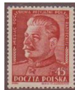
Polští důstojníci zajatí Rudou armádou neměli žádnou šanci na přežití. Na osobní Stalinův rozkaz na jaře 1940 řezníci NKVD v lesích u Katyně, Starobielsku a Ostaškova vykonali téměř 25 tisíc poprav polských důstojníků. Mezi nimi byla i řada polských sportovců a olympioniků.