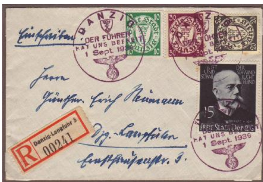
Doporučený dopis, odeslaný z Gdaňsku s německými razítky 1.9.1939 v první den II. světové války.