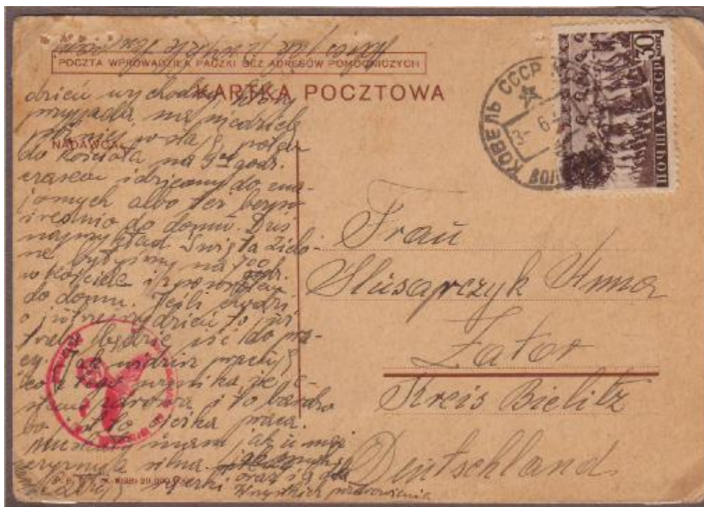
Polská poštovní dopisnice byla použita pro korespondenci členů polské rodiny z Koweku v sovětské okupační zóně do Zátoru v německé okupační zóně. Odeslána byla 6.6.1941. Již nebylo možné použít polskou frankaturu a polská známka na celině je přelepena známkou sovětskou.

Pro dezorientaci v září 1939 byla významná část polské armády internována Rudou armádou a NKVD.